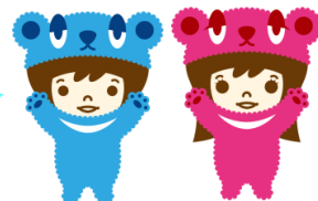
サポステオフィシャルキャラクター